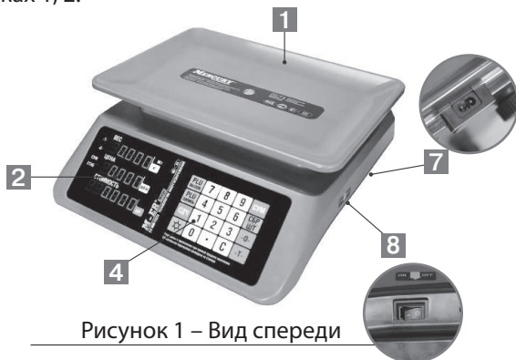
Рисунок 1 – Вид спереди