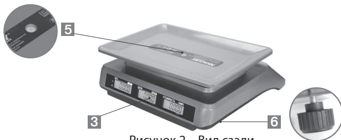
Рисунок 2 – Вид сзади