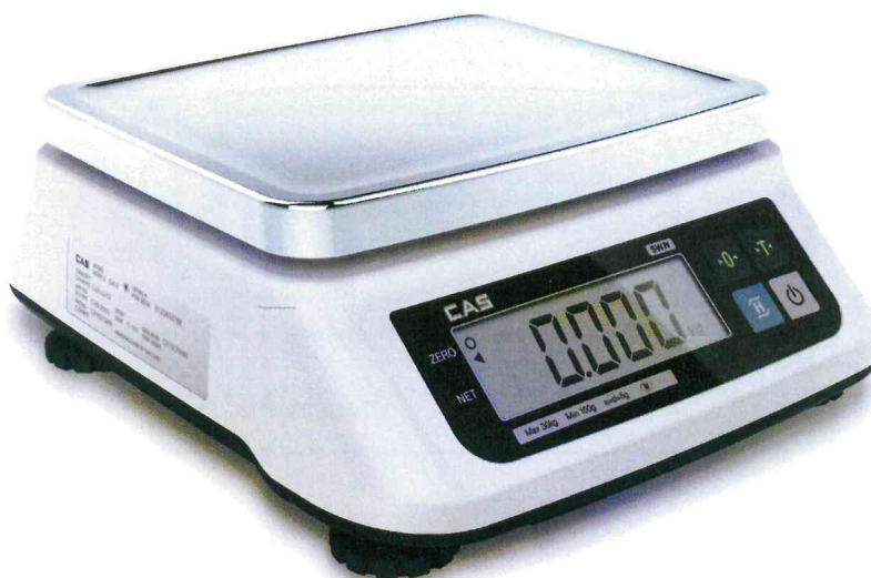
Рисунок 1 - Общий вид весов

Общий вид весов представлен на рисунке 1.