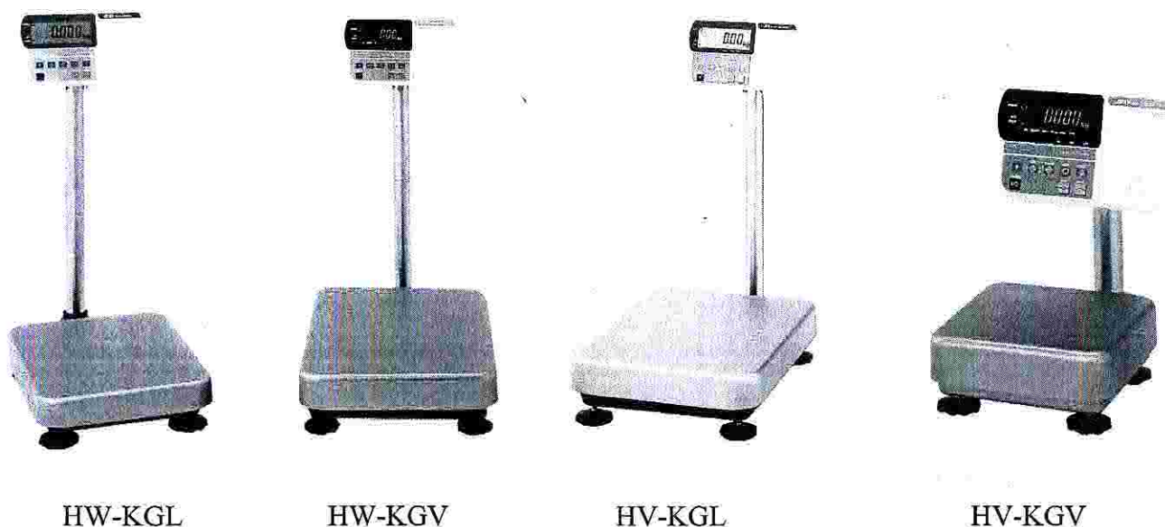
Рисунок 1 – Общий вид весов

Общий вид весов представлен на рисунке 1.